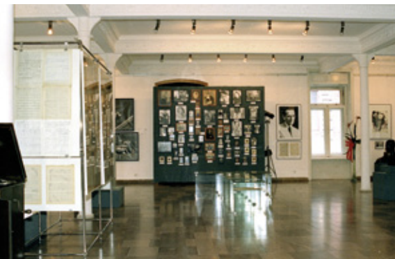
Wystawa Aleksander Tansman – Życie i Dzieło, Muzeum Historii Miasta Łodzi, 1996

Nominated for the “Energia Kultury” Award in the category of “Cultural Event” (2012) for the Hommage à Tansman project.